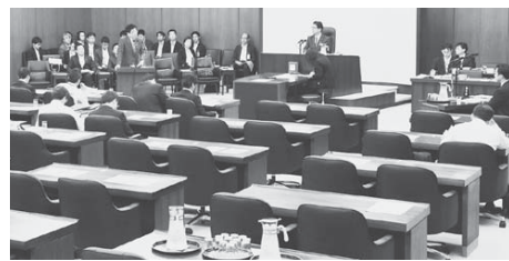
野党欠席のなかで審議が行われる衆院厚生労働委 11月2日

● 法案提出の資格なし 「働き方改革」法案は安倍政権の今国会の目玉。ところが法案の骨格である裁量労働制の拡大はデータねつ造が発覚し削除。野