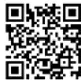
動画 QR コード