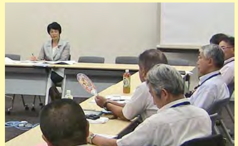
全国沿岸漁民連の皆さんと懇談＝8月19日