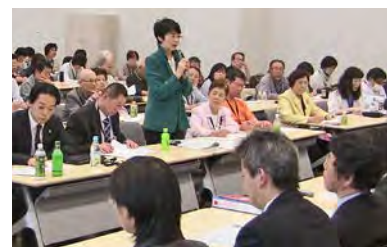
福島県農民連の皆さんと政府交渉=4月26日

被災自治体の「自立」を口実に、復興事業費の一部を自治体に押しつけることは、進みかけた復興のブレーキになると主張。復興の加速化と称して福島を切り捨てるのではなく、国と東電の責任を果たすよう求めました。