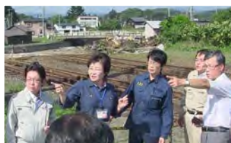
上／台風が直撃した北海道新得町の鉄橋崩落現場を調査＝9月2日