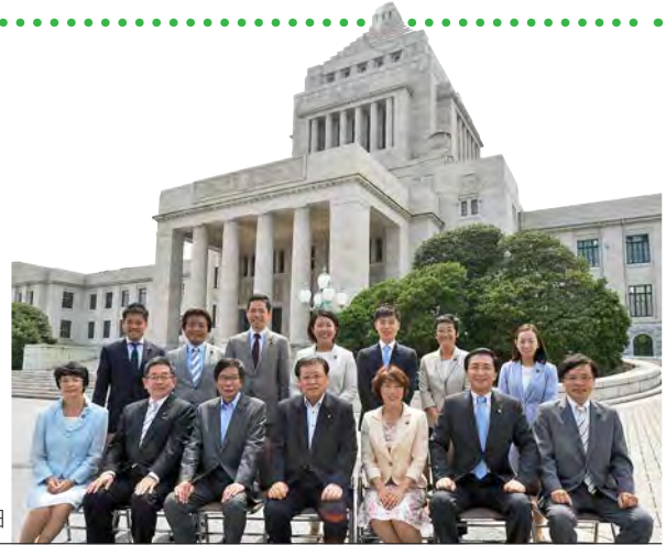
新しい参議院議員団です=8月3日