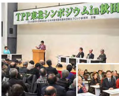
TPP東北シンポジウム in秋田＝2月21日